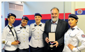
Colégio Tiradentes da Brigada Militar